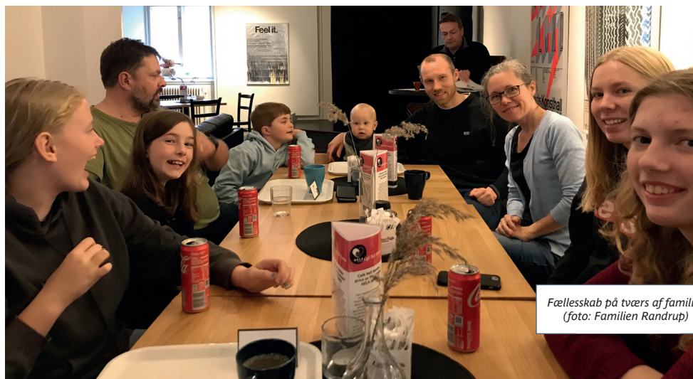
Fællesskab på tværs af familier