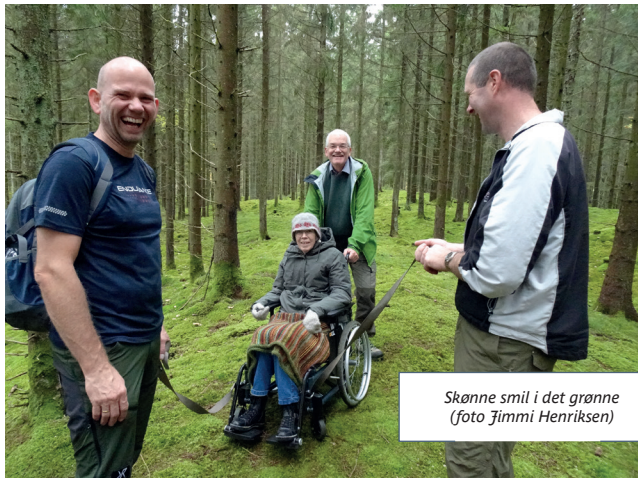
Skønne smil i det grønne