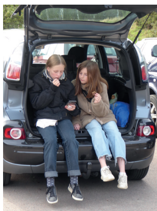
Hygge i bagagerummet

på egen hånd. På denne tur fik vi gået flere rigtig gode ture i smuk natur, som samtidig giver anledning til gode snakke