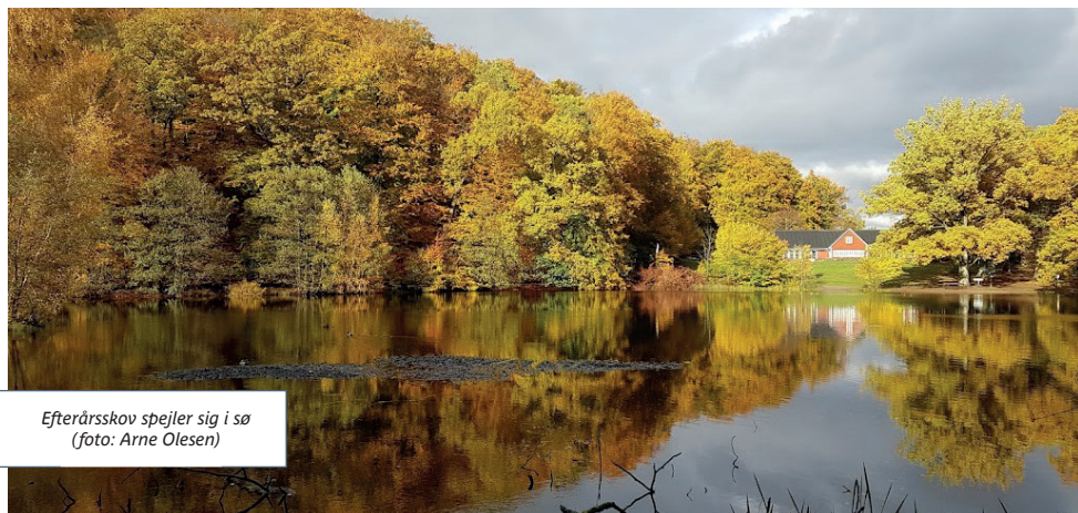
Efterårsskov spejler sig i sø