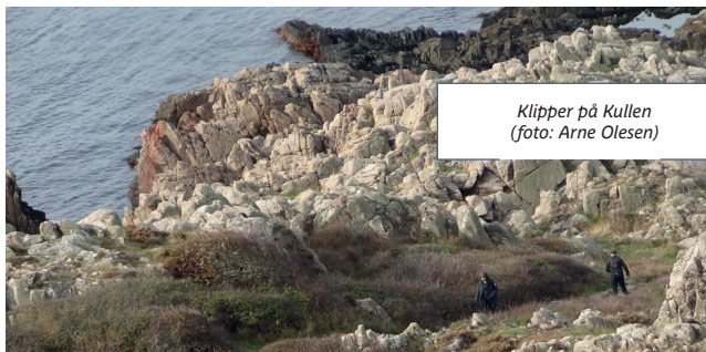
Klipper på Kullen

Det er dage med mange muligheder. Nogle dage følges de fleste af os i flok f.eks. på vandreture, som vi holder meget af. Andre gange er det en eller flere biler, der vælger et bestemt udflugtsmål. For os var det flotteste Kullen med de fascinerende klippeformationer