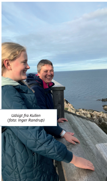
Udsigt fra Kullen