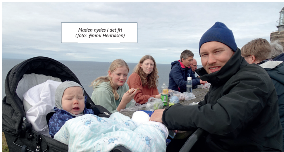
Maden nydes i det fri