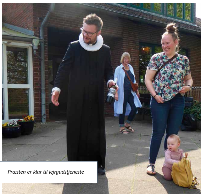
Præsten er klar til lejrgudstjeneste

Kom med næste gang, der bliver fælleslejr syd for grænsen! □