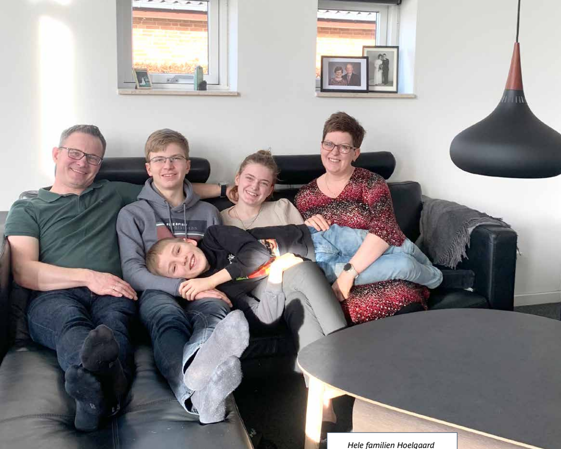
Hele familien Hoelgaard