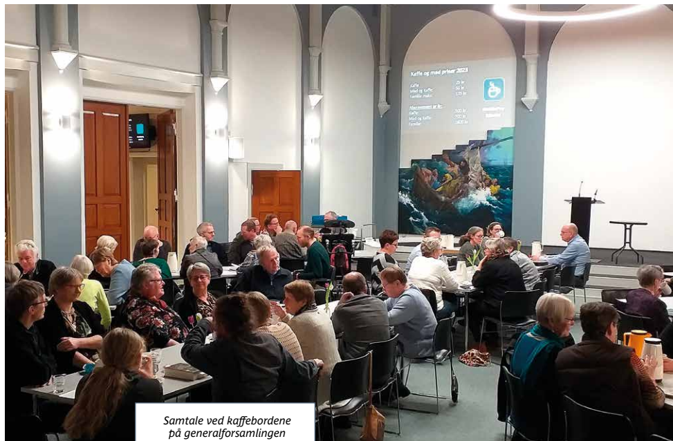
Samtale ved kaffebordene på generalforsamlingen