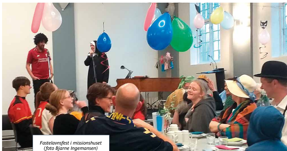
Fastelavnsfest i missionshuset