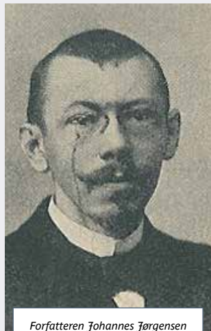
Forfatteren Johannes Jørgensen (født 1866, blev 89 år)

At Johannes Jørgensen som 30-årig vendte sig til kristendommen gav genlyd og forhåbelse i det kulturradikale miljø i København. Sjældent er et menneske blevet udskammet og forhånet så meget som Johannes Jørgensen. Georg Brandes havde håbet på, han blev en af hans disciple, men endte med at kalde ham ”den lille perverse renegat”. Johannes Jørgensen blev som den produktive forfatter han