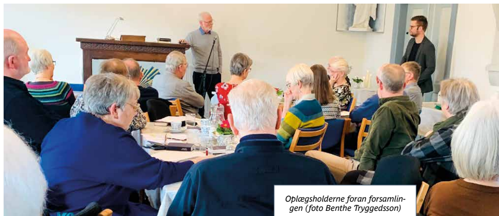
Oplægsholderne foran forsamlingen

Store spørgsmål af livsvigtig betydning. Ud over den åndelige føde, havde nogle sørget for kaffe, frokost mm. Der var bred enighed om, at en studiedag var en gentagelse værd! □